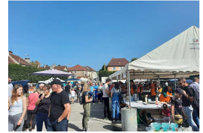
↑1 octobre : fête de la courge