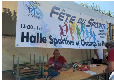
↑9 septembre : fête du Sport