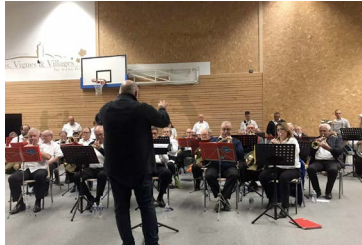
↓4 novembre : concert d'orchestres de batterie-fanfare