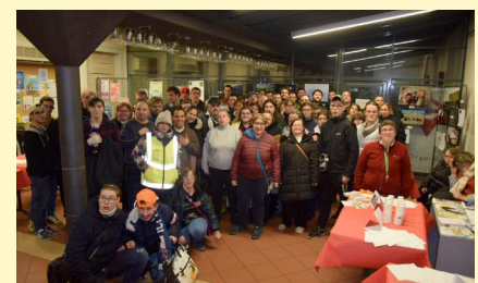
↑ DuoDay accueil de personnes en situation de handicap dans les commerces, structures et entreprises d'Arbois