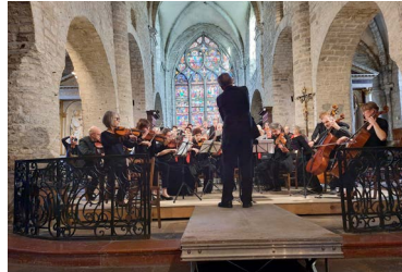
↑15 octobre : Credo et Gloria de Vivaldi