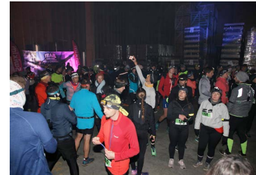
←25 novembre : Trail Nocturne