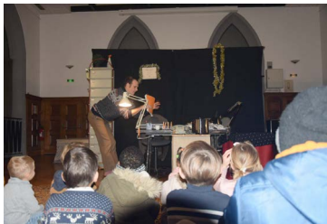
↓3 décembre : spectacle de Noël pour les familles