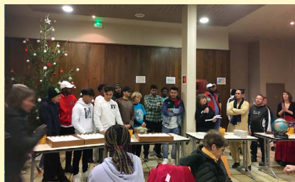
↑ Buffet des Pays : 34 recettes-21 pays