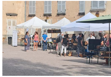
←17 septembre : Broc Music