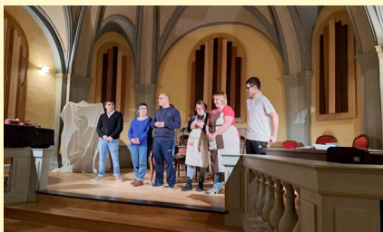
↑ Saynète de théâtre par l'association « Nous Aussi39 » (salariés de l'ESAT)