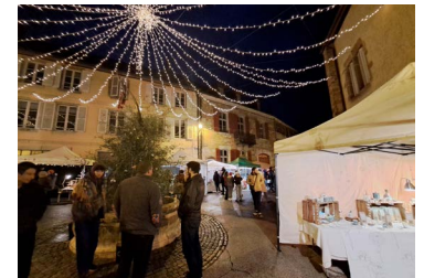
↑25 novembre : Marché de Noël Petite Place

Du 17 novembre au 4 décembre : Festival des Solidarités, de nombreux événements pour mettre en lumière les Solidarités, dont :