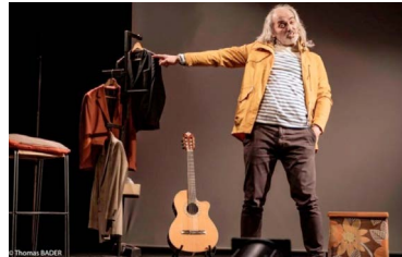
↑18 novembre : Concerts « Festival Chansons d'Automne »