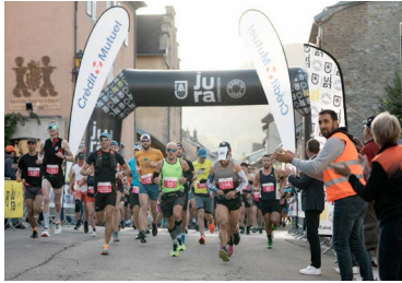
↓8 octobre : Marathon des Vins du Jura