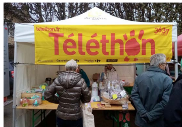
↑8 & 9 décembre : Téléthon