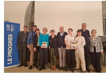
←24 octobre : Soirée hommage pour les 80 ans de la mort d'Henri Maire et sortie du livre de Michel Vernus