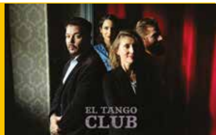
EL TANGO CLUB